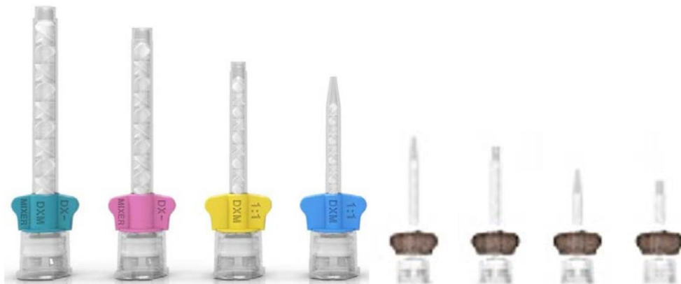
Figura A: puntali di miscelazione oggetto dell'ingiunzione